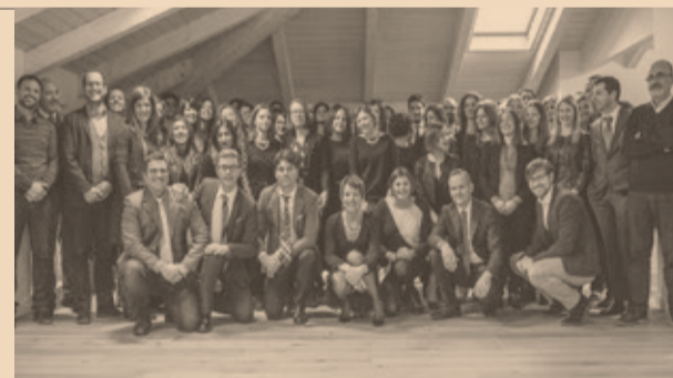
Lo staff di ErgonGroup

Strumento irrinunciabile del project management è integrare le scelte operative con il supporto teorico fornito dalla conoscenza della lean production, un approccio integrato fra modalità operative volto a creare le condizioni ottimali per far fluire i progetti. «Se la lean si occupa di efficientare e selezionare i processi a valore, il project management si occupa di migliorare l'efficacia dei processi fluidi e orientati in 'logica pull' verso tutti i clienti», sottolinea Olivo. Anche l'industria 4.0 rappresenta una grande opportunità per le aziende, ma pone grandi sfide. «Per vincerle l'organizzazione dovrà essere in grado di generare valore attraverso lo sviluppo delle competenze